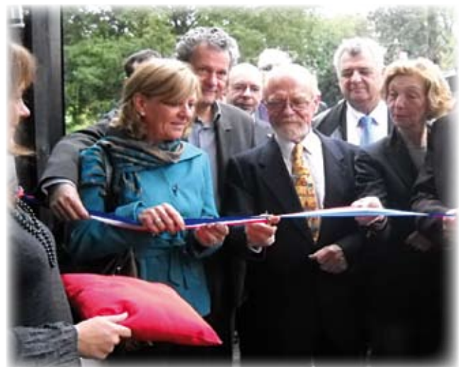
la traditionnelle coupure de ruban lors de l'inauguration du 2 octobre 2010