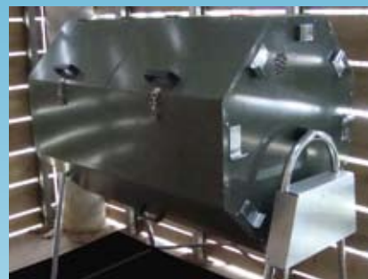
D'une capacité de 450 kg, le biofermenteur peut traiter 1,6 tonnes de déchets par an.

C'est donc avec beaucoup d'intérêt que ces tests sont suivis par d'autres communes.