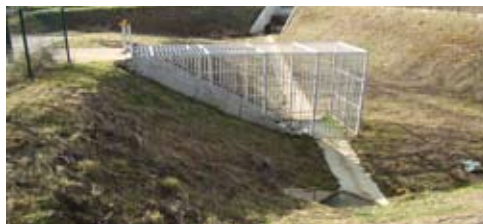
D'un coût de 209.000 €, ce bassin de rétention de 1500 m 3 permet depuis 2008 d'éviter les inondations qui touchaient Oissey

À l'image du bassin de rétention de 1500 m 3 construit à Oissey en 2008, le Pays de la Goële et du Multien s'est donc engagé dans