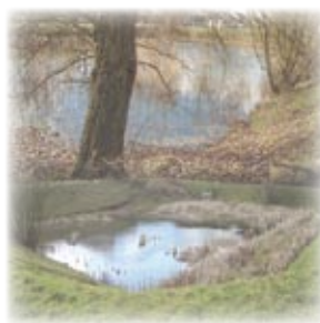
Après travaux la capacité totale de ces deux bassins de rétention situés à Saint-Pathus va être augmentée de près de 80 %

À défaut d'empêcher les ruissellements, il est capital d'en limiter les effets, c'est pourquoi d'autres réalisations sont envisagées.