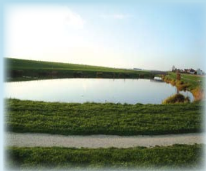
A l'image de la ZAC de Saint-Pathus, des bassins de rétention sont souvent la solution retenue pour la gestion des eaux pluviales des zones d'aménagement.

Il stipule notamment, les matériaux à employer et les méthodes à respecter pour la pose des canalisations et la nécessité d'inclure une gestion des eaux pluviales.