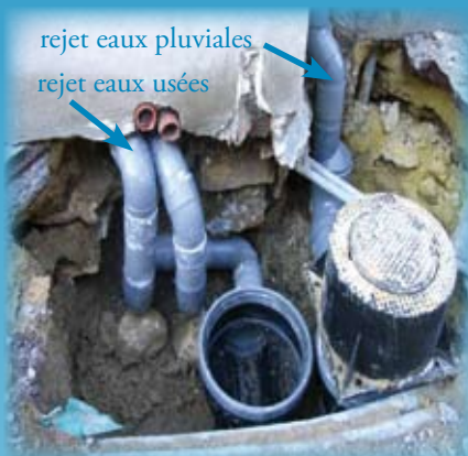
Exemple de travaux de raccordement à effectuer lors de la mise en séparatif des réseaux.

Ils consistent en la pose de 700 mètres linéaires de tuyaux pour un coût de 276810€.